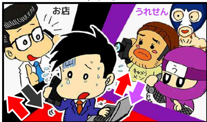
お店とうれせんとの取材交渉で忙しい！他にも仕事があるのに…