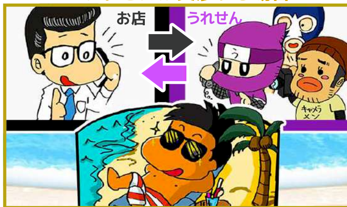
お店とうれせんで直接交渉！空いた時間で小麦色になっちゃうぜ！